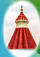
Kalady (Birth Place of Shankaracharya)

अवतीर्णश्च कालट्यां केदारेऽन्तर्हितश्च यः । चतुष्पीठप्रतिष्ठाता जयतात् शङ्करो गुरुः ॥