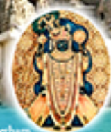
Paschimamnaya Sri Kalika Peetham, Dwarka (Gujarat)