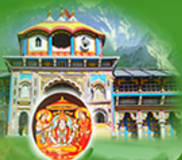
Uttaramnaya Sri Jyotish Peetham, Badari (Uttarakhand)