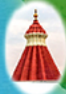
Kalady (Birth Place of Shankaracharya)

अवतीर्णश्च कालट्यां केदारेऽन्तर्हितश्च यः । चतुष्पीठप्रतिष्ठाता जयतात् शङ्करो गुरुः ॥