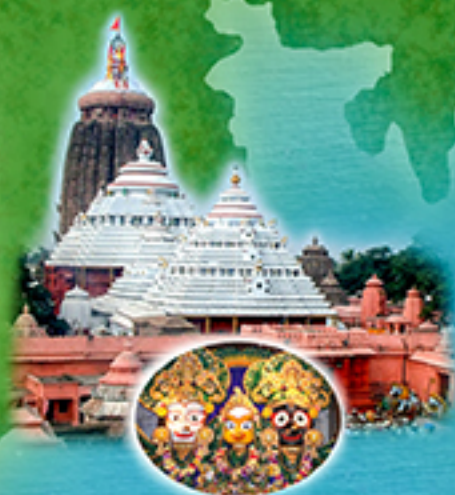
Poorvamnaya Sri Govardhana Peetham, Puri (Odisha)