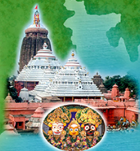
Poorvamnaya Sri Govardhana Peetham, Puri (Odisha)

अवतीर्णश्च कालट्यां केदारेऽन्तर्हितश्च यः । चतुष्पीठप्रतिष्ठाता जयतात् शङ्करो गुरुः ॥