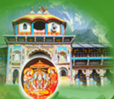
Uttaramnaya Sri Jyotish Peetham, Badari (Uttarakhand)