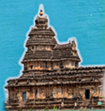
Dakshinamnaya Sri Sharada Peetham, Sringeri (Karnataka)