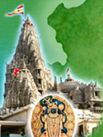
Paschimamnaya Sri Kalika Peetham, Dwarka (Gujarat)